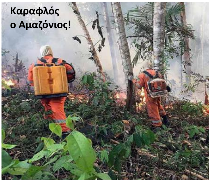
Καραφλός ο Αμαζόνιος!