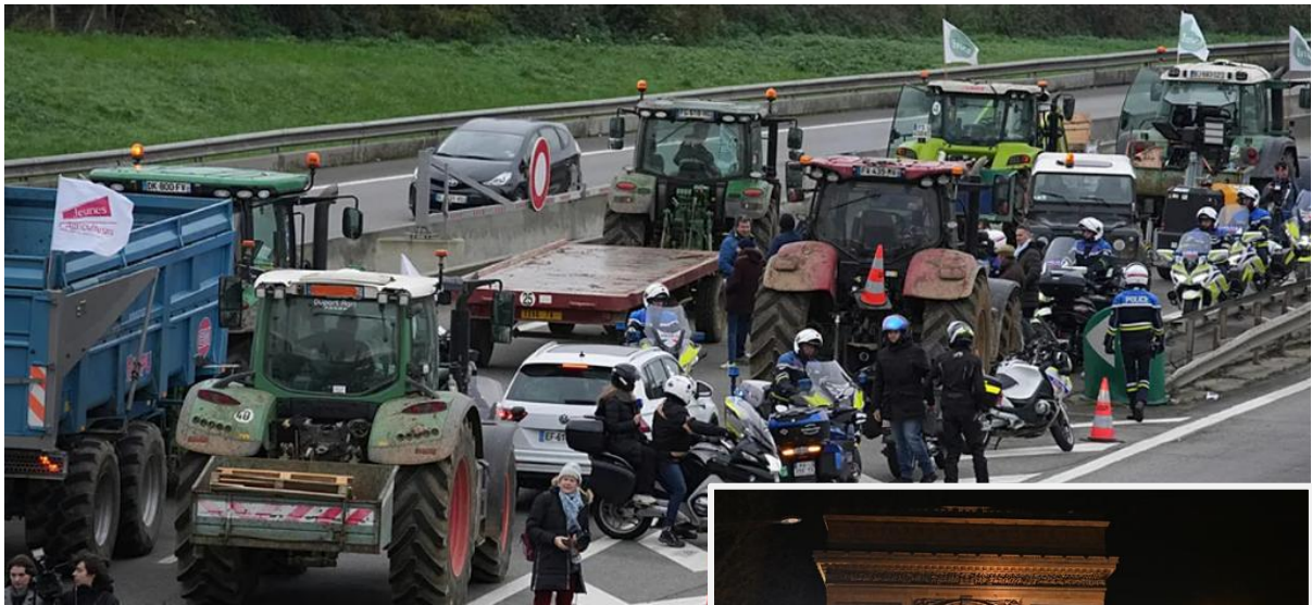
Πέρα από 350 τρακτέρ συρρέουν στο Παρίσι

Και αυτά, εν μέσω συγκλονιστικών αγροτικών κινητοποιήσεων στην Ευρώπη.