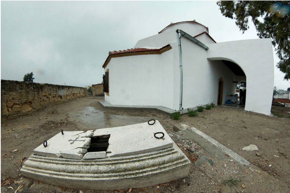
Ναός του 16ου αιώνα στο χωριό Τραχώνι Κυθρέας

Μία μέρα του Δεκέμβρη, από τις θυελλωδέστερες που μπορεί να πέρασε η Κύπρος κρύο, παγωνιά, χιονιά, βροχές κλπ. κι όμως γέμισε η εκκλησία κόσμο που ήρθε από παντού. Εκεί διαπίστωσα ότι υπήρξαν χωρικοί, που έρχονταν για πρώτη φορά στο χωριό τους, άνθρωποι με προκατάληψη που δεν ήθελαν ποτέ να περάσουν από την άλλη πλευρά, άνθρωποι που πήγαν στις γειτονιές τους και είδαν το σπίτι τους να κατοικείται από άλλους και όταν μπήκαν μέσα στην εκκλησία του χωριού ένιωθαν μια ευδαιμονία. Θυμάμαι μάλιστα συγκεκριμένο πρόσωπο, γνωστό από την νεότητα μου, που γυρίζει και μου λέει «ξέρεις εδώ στεκόμουν και όταν ήμουν μικρό παιδί και σήμερα είναι η ευτυχέστερη μέρα της ζωής μου». Πήγε στο χωριό του το κατεχόμενο και είδε στο σπίτι του να κατοικούν άλλοι και ήταν η ευτυχέστερη μέρα της ζωής του. Ένοιωσα τι σημαίνει ο δεσμός των ανθρώπων με τους χώρους της ιστορίας και της παράδοσής τους. Εκεί στο Τραχώνι της Κυθραίας είδα για πρώτη φορά Τ/Κύπριους να απλώνουν χέρι συνεργασίας, είδα το κόσμο που μας φιλοξένησε. Μέσα σε αυτό το κλίμα αντιλήφθηκα ανθρώπους οι οποίοι θέλησαν να εγκαταστήσουν φιλικές μεταξύ τους σχέσεις. Το μνημείο γινόταν ένας χώρος ύπαρξης, συνύπαρξης, συμπόρευσης, κατανόησης, αλληλοκατανόησης, μέσα στη δυστυχία των ανθρώπων, γιατί και οι Τ/Κύπριοι που βρίσκονταν εκεί κάποιο σπίτι εγκατέλειψαν.