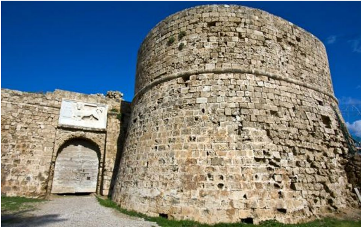
Ο Πύργος του Οθέλλου, Αμμόχωστος

Μέσα από τις διαδικασίες μας προσπαθήσαμε να προωθήσουμε την έννοια της επικοινωνίας των ανθρώπων. Τότε στην εποχή του Ταλάτ, και αργότερα του Ακιντζί, συναντούσαμε κατανόηση. Η παραλαβή ενός μνημείου ήταν ένα μεγάλο γεγονός. Πληροφορούσαμε προηγουμένως του Τ/Κύπριους, τους ενημερώναμε τί πάμε να κάνουμε, παίρναμε τους Ε/Κύπριους για να παρακολουθήσουν την εξέλιξη των έργων, οργανώναμε μεγάλες γιορτές και τελετές, ολόκληρα πανηγύρια με την παραλαβή ενός έργου. Έρχονταν οι άνθρωποι σε επαφή, υπήρχε επικοινωνία μεταξύ των ανθρώπων, δημιουργούνταν σχέσεις, αλληλοκατανόησης, ελπίδας και προοπτικής.