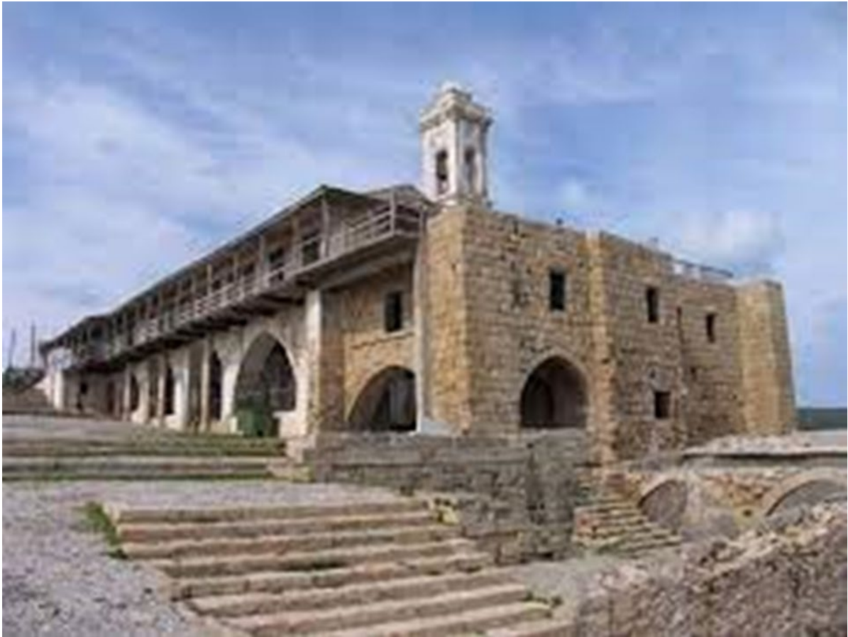
Το Μοναστήρι του Αποστόλου Ανδρέα στην Καρπάσια

Προχωρήσαμε λοιπόν φίλοι μου, μέσα σε αυτή τη διαδικασία και είχαμε πρόγραμμα. Άρχισε να διαδέχονται το ένα μνημείο μετά το άλλο, το καθένα με την δική του σημασία. Να πω για παράδειγμα για τον Απόστολο Αντρέα, έχει σημασία, η αποκατάστασή του εξελίχθηκε σε μια περιπέτεια απίστευτη. Άρχισε να γίνεται λόγος για την αποκατάστασή του το 2000 με χρηματοδότηση Αμερικανών. Προέκυψαν διαφωνίες πάνω στα σχέδια που ετοιμάστηκαν με αποτέλεσμα να ματαιωθεί το έργο. Το Χαλά Σουλτάν προχώρησε κανονικά και ολοκληρώθηκε η αποκατάστασή του. Ο Απόστολος Ανδρέας έμεινε εκεί ατημέλητος με τη φθορά να γίνεται όλο και πιο αισθητή. Όταν το 2008 η κατάσταση του επιδεινώθηκε περισσότερο και έφτασε να μπαίνουν θέματα ασφάλειας για τους επισκέπτες και το κτίσμα να θεωρείται επικίνδυνο το ζήτημα έφτασε κοντά μας. Είναι τότε που μας πληροφόρησαν ότι θα έβγαινε ανακοίνωση για απαγόρευση των επισκέψεων για να μην έχουμε και καινούργιο Μαρί.